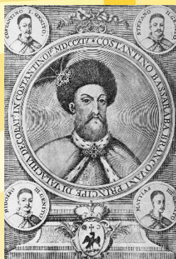
Constantin Brâncoveanu și cei patru fii ai săi